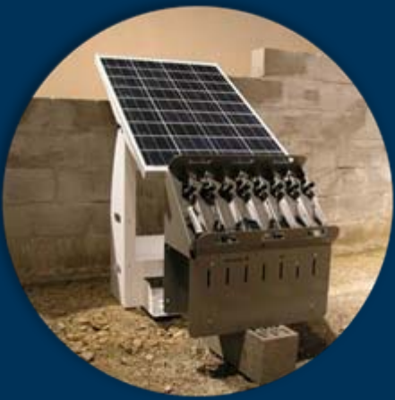
Village Solar Charger