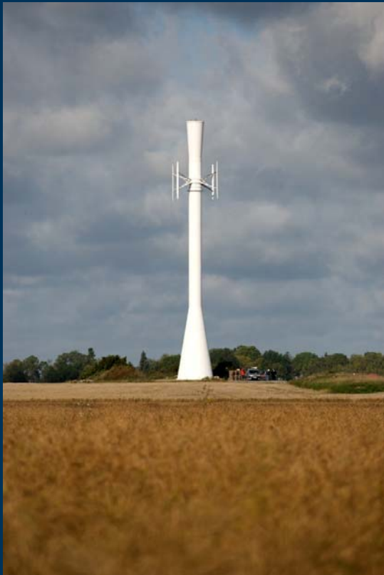
Ericsson Tower Tube