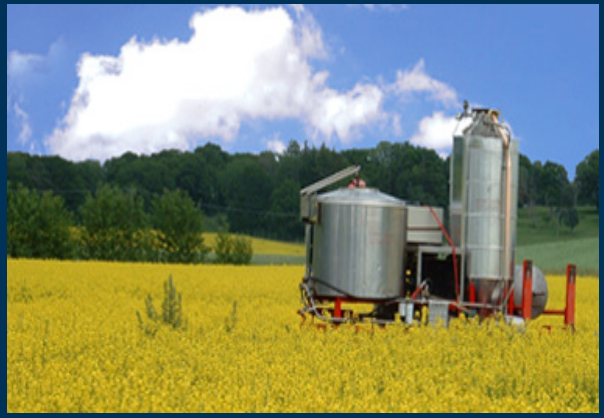
Green Site Solutions